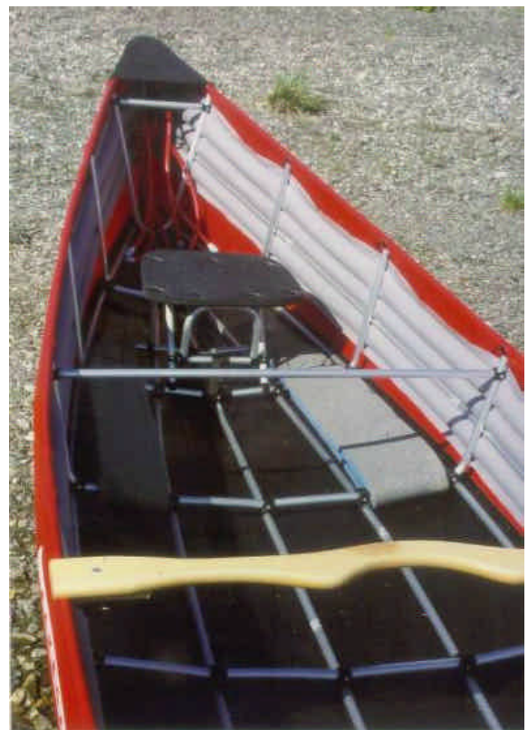
Boot ist komplettiert: Zu sehen sind die Luftkammern (grau) mit Füllschläuchen, Stoffkappe am Heck, Sitz und Kniepolster, sowie Tragejoch.

Die Sitze können an mehreren verschiedenen Stellen im Boot positioniert werden. Zum individuellen Trimmen des Kanus schon von großem Vorteil.