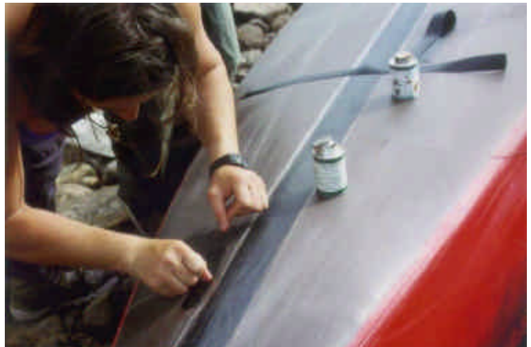
Fachgerechte Reparatur mit abgerundetem Flicker

Optimal ist es, wenn die Klebeflächen vorher mit Aceton gereinigt werden können (z.B. bei Bastelarbeiten zu Hause).