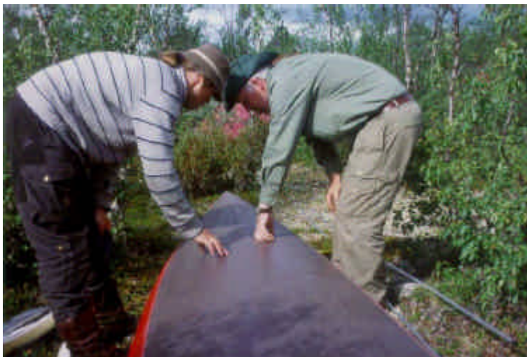
Sichtkontrolle nach den zahlreichen strapaziösen Stromschnellen

Dass bei Portagen die Boote durchs dichte Unterholz geschleift werden müssen, oder über grobes Blockwerk und Steilstufen in Schluchten abgeseilt werden, kommt dann noch hinzu.