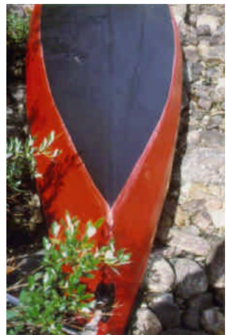
Der Bootshaut ist kaum etwas anzusehen